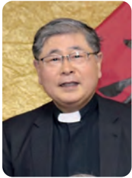
■ グリーフケア研究所