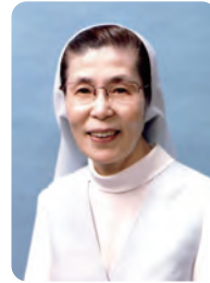
■ グリーフケア研究所

グリーフケアを学ぶことは、自らの心の支えを確かめていくことであり、死生観や宗教文化やアートの力について学んでいくことでもあります。人生のある段階で、これまで歩いてきた道を振り返り、これからの人生へ、また来るべき自らの死に備えるための学びともなるでしょう。